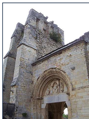
Notre-Dame du Pré près de Donzy