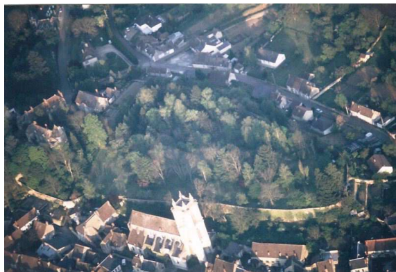
L'ancien « castrum » de Donzy